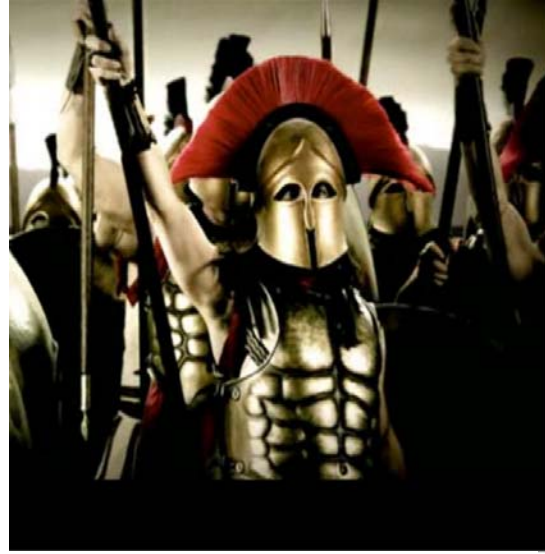
Leonidas Documental “La batalla Final de los 300”