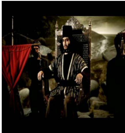
Rey Persa Jerjes Documental "La batalla Final de los 300"