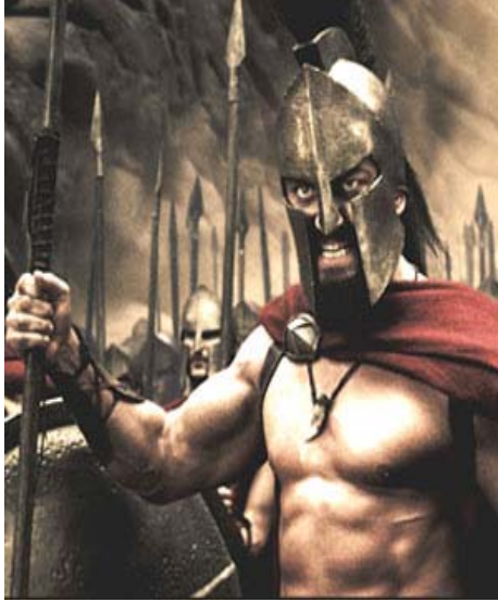
Leonidas Película 300